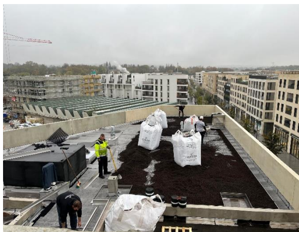
2000 m 2 de végétalisation SUCCULIS sur AQUASET NEO sur la toiture de logements à Chatenay-Malabry (92) par les équipes chantier ECOVEGETAL