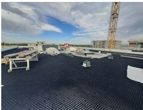
Pose AQUASET NEO sur la toiture R+6 du Village des médias des JO à Dugny (93) par notre client ID VERDE

AQUASET NEO résiste à des températures allant de -30°C à +60°C, de même qu'à une compression verticale de 30 T/m 2 maximum selon la norme ISO 844. Sa masse volumique est de 46 kg/m 3 . La Taux de vide est de 95%. Ce système breveté sous ETN N°A27T200E résiste au vent. Le système est superposable (2 couches maximum). Il se pose bords-à-bords. En climat de plaine (alt. <900m) il demande à être posé sur un élément porteur en maçonnerie avec une pente nulle ou < à 5 %.